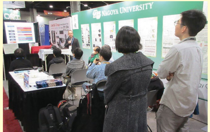
SC24ブースでの招待講演の様子 An invited presentation at SC24 booth.

We exhibited at the international conference SC24 held in Atlanta, Georgia, USA from November 17th to 22nd, 2024, with the aim of providing computing resources in Joint Usage / Research Center (JHPCN Centers), service operations, and outreach of research activities.) In addition to the poster exhibition, faculty from Carnegie Mellon University and other JHPCN centers delivered invited presentations, followed by lively Q&A sessions. https://icts.nagoya-u.ac.jp/ja/exhibition/sc/2024/