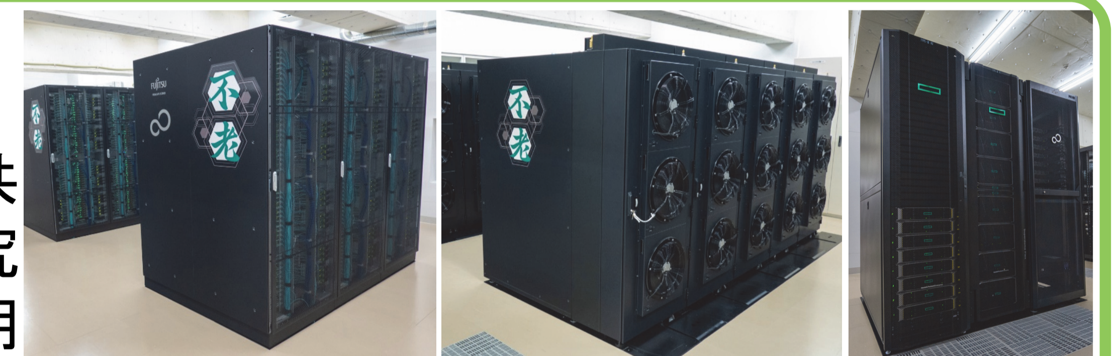
スパコン「不老」サブシステム Type I~III