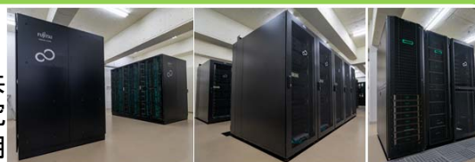
スパコン「不老」サブシステム Type I~III

全国の大学等の広範囲にわたる学術研究、学際大規模情報基盤共同利用・共同研究拠点の共同研究活動、HPCIを活用した萌芽的研究から大規模研究まで、さらに産業利用にわたる幅広いHPC計算利用を加速するサービスです。