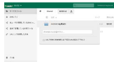
NUSSによるデータ共有

NUSS(Nagoya University Storage Service)は、名古屋大学に所属する教職員の教育研究に関わるデータの保管・管理に関する利便性向上と教職員間での円滑なデータ共有の支援を目的として提供するファイル共有サービスです。名古屋大学IDを指定してのファイルやフォルダの共有、URLによるファイル公開などが可能です。セキュリティレベルを上げたNSSSもあります。