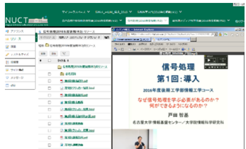
NUCTによる講義関連情報の管理

NUCT(Nagoya University Collaboration and course Tools)は、e-Learningシステムの一つで、授業ホームページを運用するためのWebアプリケーションです。教員は、NUCTに教材や資料をアップロードしたり、テストの作成をしたり、スキャンした紙レポートを管理したり、様々なツールを使ってネット上の授業を開講し、実施することが可能です。学生は、いつでもどこからでも授業のワークサイトにログインして、教材を閲覧したり、テストを受けたり、課題を提出したりすることができます。