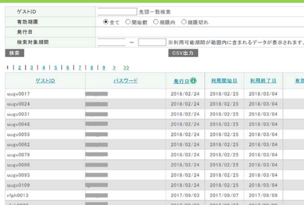
NUWNETゲストアカウント発行インタフェース

名古屋大学IDを用いて認証可能(802.1x認証、ウェブ認証)な全学無線LANシステムであるNUWNETを提供しております。現在、NUWNETのアクセスポイント数は1500台を越え、建物の新設/改築時の整備や部局負担の増設などでその数は増加中です。これらのアクセスポイントは、同時に、eduroamのアクセスポイントでもあります。また、学会参加者や短期滞在研究者のNUWNET利用を可能とするNUWNETゲストアカウントの発行が可能です(教職員に限る)。現在、BYODベースの教育基盤として利用可能なよう、大規模な増強を計画しております。