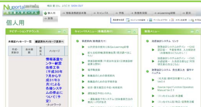
ポータルトップページ(カスタマイズ済)

名古屋大学ID所持者に対して名古屋大学が提供する情報サービスを集約したポータルであり、トップページは利用者がよく使う項目のポートレットを配置するカスタマイズも可能です。学生からは履修登録、休講/補講/試験/成績情報の確認でよく利用するサイトになります。教員からは教務の手続き、財務手続き、施設予約などでよく利用するサイトになります。現在、より利便性の高い新ポータルへの移行を計画しております。